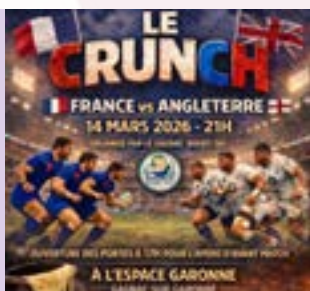
14 mars, 21h Match France-Angleterre Espace Garonne