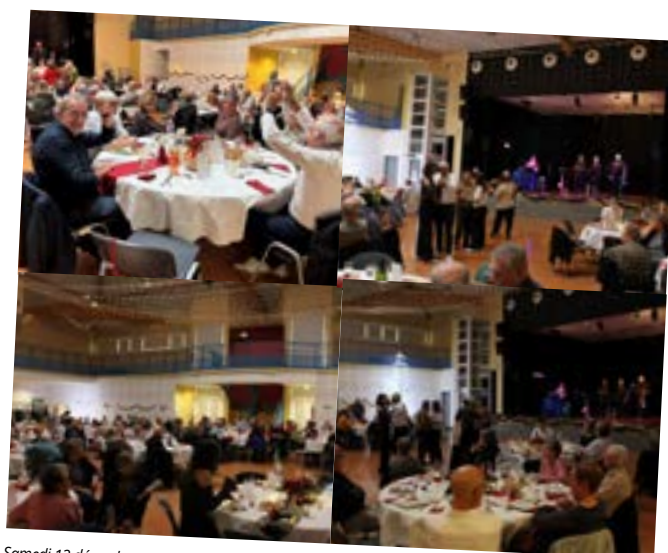
Samedi 13 décembre, avait lieu le traditionnel repas des aînés !