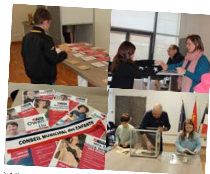
Jeudi 27 novembre, jour d'élections pour le Conseil Municipal des Enfants