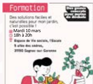
Mardi 10 mars - 18h à 20h Formation sol fertile - Toulouse Métropole EVS