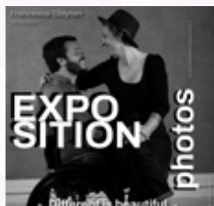
Vendredi 13 fév. 18h30 Conférence sur le handicap EVS