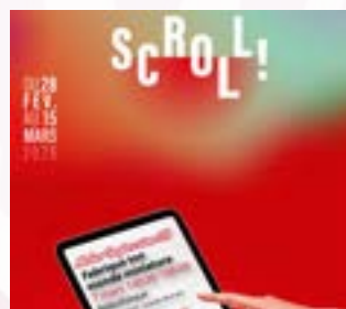
Du 28 fév. au 15 mars Festival numérique des bibliothèques Bibliothèque