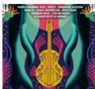
Judi 19 mars - 20h Festival Guitare Espace Garonne