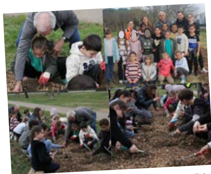
Mercredi 17 décembre, les petits gagnacais se sont mobilisés pour créer une micro forêt, allée du Bac, selon la méthode Miyawaki.