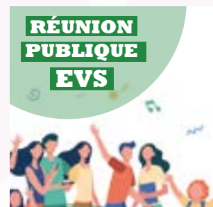
Vendredi 20 fév. 18h30 Réunion publique EVS EVS