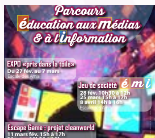
Du 27 fév. au 8 avril Parcours Éducation aux médias et à l'information Bibliothèque et EVS