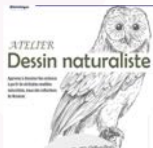
Vendredi 13 fév. 18h-19h30 Atelier dessin naturaliste Bibliothèque