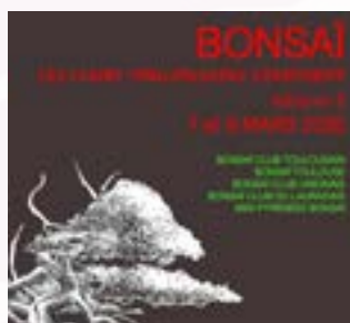
Samedi 7 mars, 14h30 Exposition Bonsaï Espace Garonne