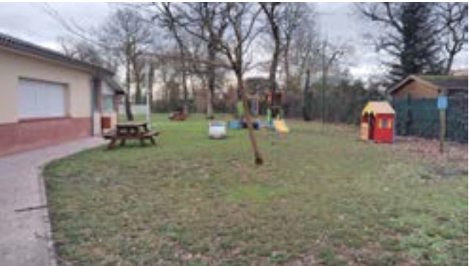
Le jardin du RPE

Tout au long de la semaine, des ateliers tournants, d'une durée d'environ vingt minutes chacun, permettront aux participants de découvrir différentes propositions.