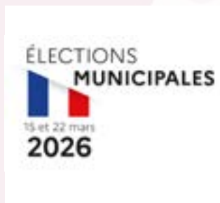
Dimanche 15 & 22 mars Élections municipales Salle du conseil - Hôtel de Ville