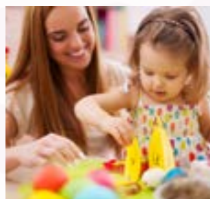
17 & 20 mars Semaine de la Petite Enfance EVS