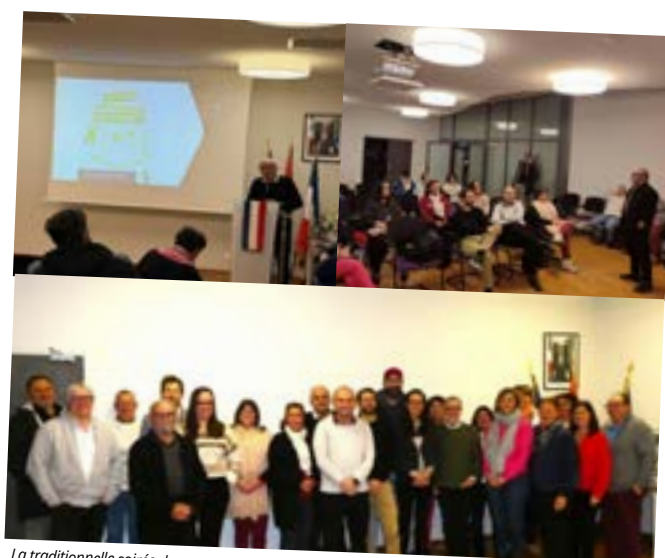
La traditionnelle soirée des nouveaux arrivants a eu lieu jeudi 4 décembre à l'hôtel de ville.