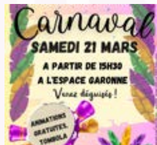
Samedi 21 mars Carnaval Espace Garonne