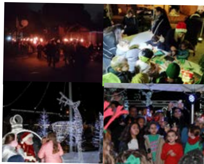
La Fête de l'Hiver a illuminé la place de la République avec une soirée pleine de magie vendredi 5 décembre.