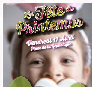
Vendredi 17 avril Fête du printemps Place de la République