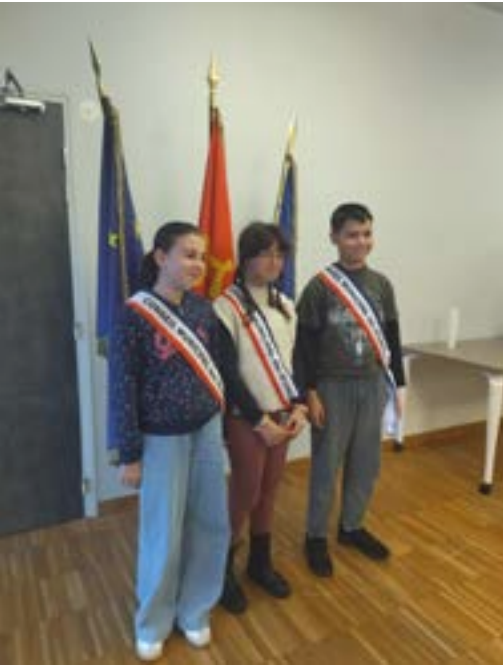
Une partie de l'équipe du CMJ