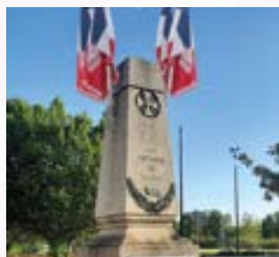
Judi 19 mars - 16h30 Cérémonie 19 mars 1962 Monument aux morts