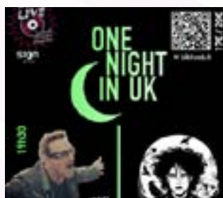
Vendredi 21 fév. 19h30 Concert de musique Espace Garonne