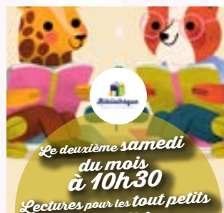
Samedi 14 fév. 10h30 Lecture des pitchouns Bibliothèque