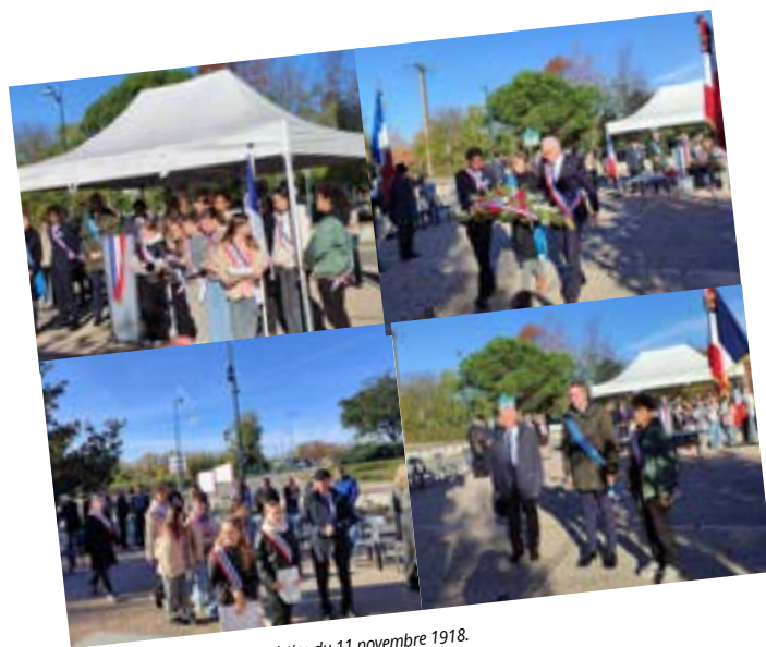
107ème anniversaire de l'Armistice du 11 novembre 1918.