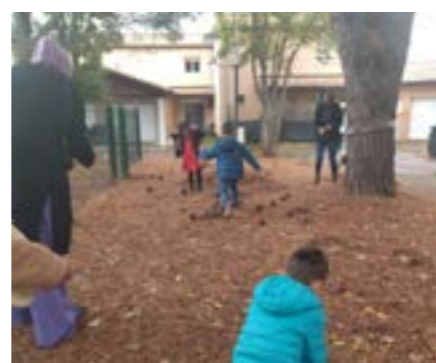
Cueillette des pommes et des épinettes de pin