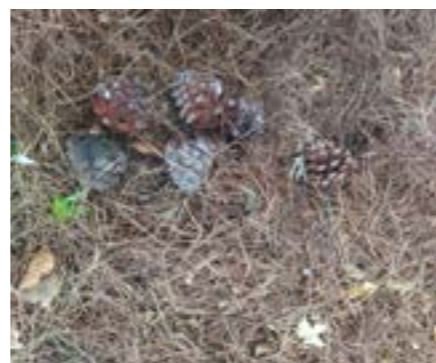
Pommes de pin trouvées par les enfants