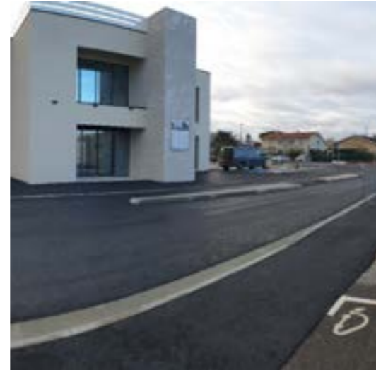
Vue de la rue du Chêne Vert

de la chaussée. Ces travaux préfigurent ainsi le nouveau visage du secteur avec l'aménagement prochain du Pôle Santé et la création de l'Espace de Vie Sociale dans le courant de l'année 2024. Rappelons enfin que de nouvelles places de stationnement ont été créées l'été dernier devant l'école maternelle.