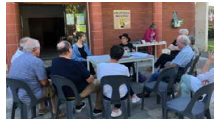
Rencontre avec Laurence Biberfeld

Cet automne, la bibliothèque municipale a eu la chance de recevoir Laurence Biberfeld dans le cadre du festival Toulouse Polar du Sud. Cette écrivaine de romans noirs nous a parlé de la manière dont sa propre vie et l'état du monde inspiraient son œuvre, dans laquelle on compte des romans jeunesse et des polars plus sombres destinés aux adultes. Si vous n'avez pas pu assister à cette rencontre, il n'est néanmoins pas trop tard pour découvrir cette œuvre : les personnages tour à tour attachants et effrayants de Laurence Biberfeld vous attendent à la bibliothèque... Vous serez certainement fascinés par ces détectives du quotidien qui enquêtent aussi bien sur les origines des inégalités dans le monde réel que sur les crimes mystérieux et fictionnels.