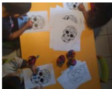
Coloriage de masques