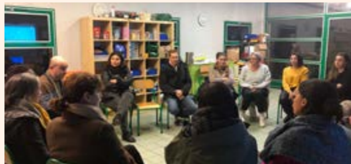
Bla-bla des parents

Jeudi 23 novembre, une quinzaine de parents ont répondu présent à l'appel de ce moment particulier et ont échangé autour de toutes ces questions. Ce Bla-bla était l'occasion de partager leurs expériences, leurs conseils et d'échanger autour de ce temps de ressources.