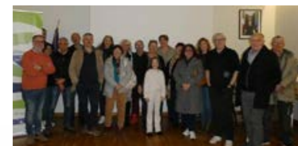
Les nouveaux arrivants en présence des élus