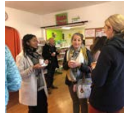
Petit-déjeuner à la bibliothèque