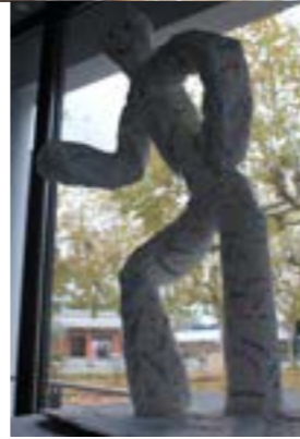
Bonhomme en papier mâché

faisant référence aux dix principes de la charte nationale d'accueil du jeune enfant. Il s'agissait de créer une illustration autour de ces principes fondamentaux, parmi lesquels : la bienveillance, l'accueil, le contact réel avec la nature ou encore la valorisation des qualités personnelles de l'enfant en dehors de tout stéréotype.