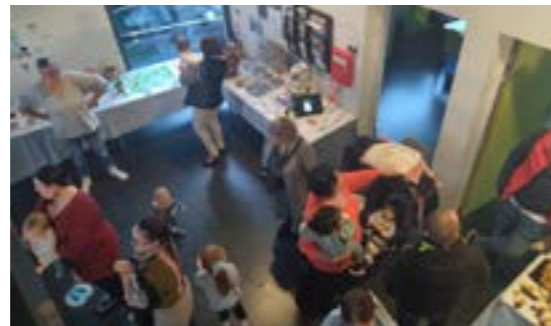
Vernissage de l'exposition

La soirée du 17 novembre était l'occasion de célébrer le vernissage de deux événements : l'exposition des illustrations de la charte Nationale des modes d'accueil du jeune enfant créées par les assistantes maternelles et la journée internationale des droits des enfants qui se déroule traditionnellement le 20 novembre.