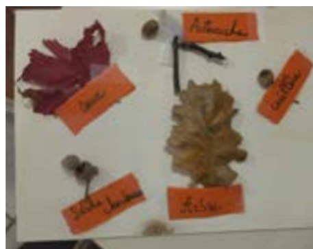
Oeuvres réalisées par les enfants et les parents