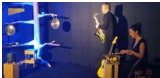
Spectacle de Noël, vendredi 8 décembre.

Chaque année pour les fêtes de fin d'année, le service parentalité et la municipalité organisent des événements gratuits pour tous les enfants : le goûter de Noël avec le club de l'amitié, des spectacles, la venue du Père Noël... !