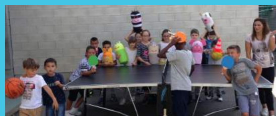
Table de ping-pong et bowling géant offert par l'APE au Centre d'Animation. Ces cadeaux ont été financés grâce aux actions menées toute l'année par l'APE.