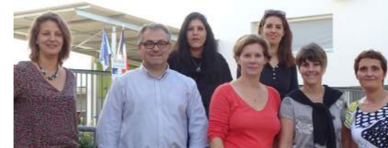
Photos de haut en bas : Parents d'élèves école maternelle | Parents d'élèves école élémentaire.