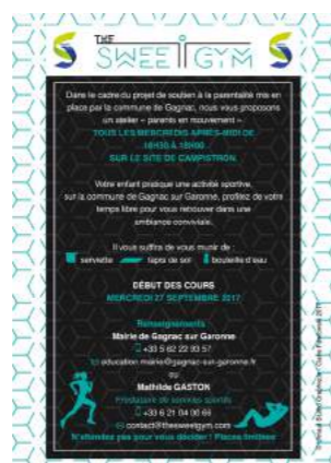
À gauche : Parents en mouvement | À droite : Soirée Théâtre-Débat « Les douces violences ».