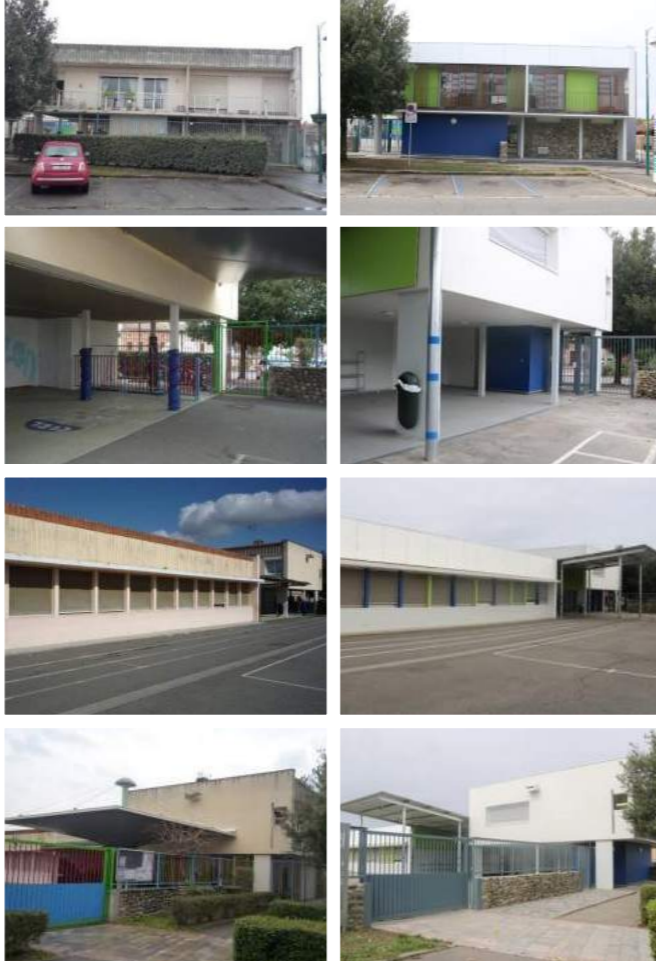
Photos à gauche : avant la rénovation | Photos à droite : après la rénovation.