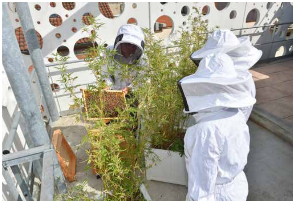
Des ruches sur le toit de la maison de la citoyenneté du Nord de Toulouse pour agir en faveur de la biodiversité.

Tandis que le gouvernement dévoilait son Plan Climat début juillet, Toulouse Métropole planchait déjà sur la déclinaison opérationnelle de son Plan Climat Air Énergie Territorial, adopté en avril dernier. Un plan très ambitieux, à la hauteur des enjeux.